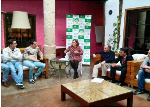
Hotel Posada Real Casa del Abad Ampudia (PA) Febrero 2016.