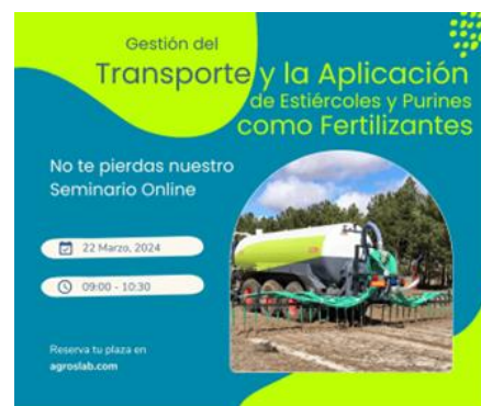
Taller Gratuito Online Viernes, 22 de marzo a las 9:00

aGROSLab GEF integra una herramienta de gestión, un visor GIS y una intuitiva app para que los aplicadores puedan desarrollar su trabajo sin error y su actividad quede registrada en tiempo real