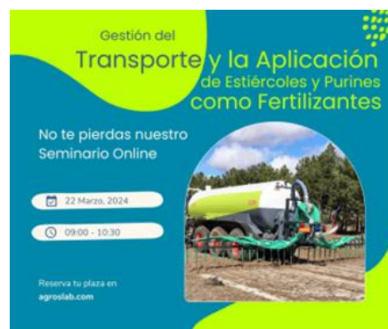
Taller Gratuito Online Viernes, 22 de marzo a las 9:00

aGROSLab GEF integra una herramienta de gestión, un visor GIS y una intuitiva app para que los aplicadores puedan desarrollar su trabajo sin error y su actividad quede registrada en tiempo real