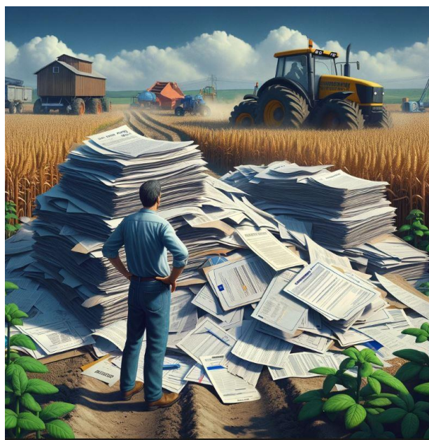
La burocracia de la PAC.

Para que no te pierdas nada, a través de este enlace podrás recuperar, en cualquier momento, la información sobre la PAC remitida desde Urcacyl durante la campaña 2023 y 2024.